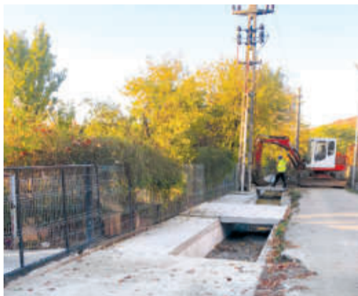
Fundătura Nicolae Bălcescu