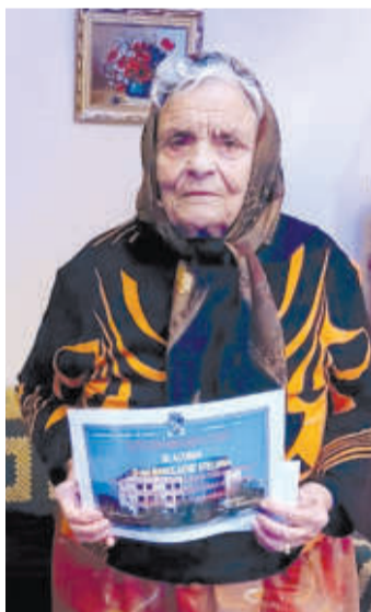
La mulți ani din partea Primăriei Vălenii de Munte!

Oricare comunitate are nevoie de vârstnici, de seniori, iar respectul acordat acestora, prin puterea exemplului dat de autorități, le arată tinerilor valoarea inestimabilă a înțelepciunii, seriozității și bunătății generațiilor înaintate în viață.