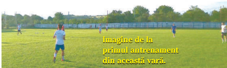
Imagine de la primul antrenament din această vară.

CSO Teleajenul dispută în perioada de pregătire o serie de amicale, primele dintre acestea cu trupele din Starchiojd, Strejnic, Moreni.